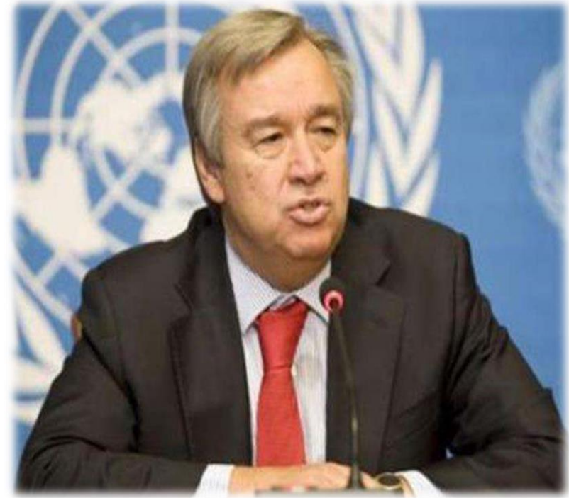
现任联合国秘书长： 安东尼奥·古特雷斯