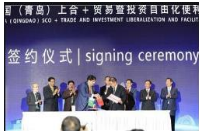
加强同多边贸易规则的对接