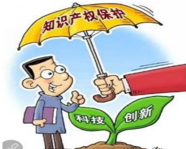
强化知识产权保护