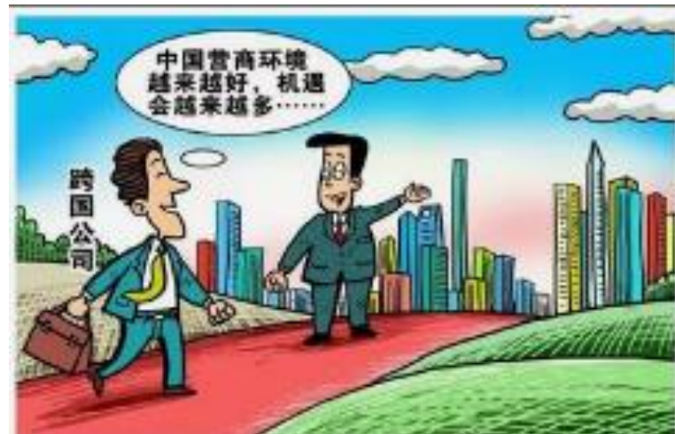
提供更多就业机会