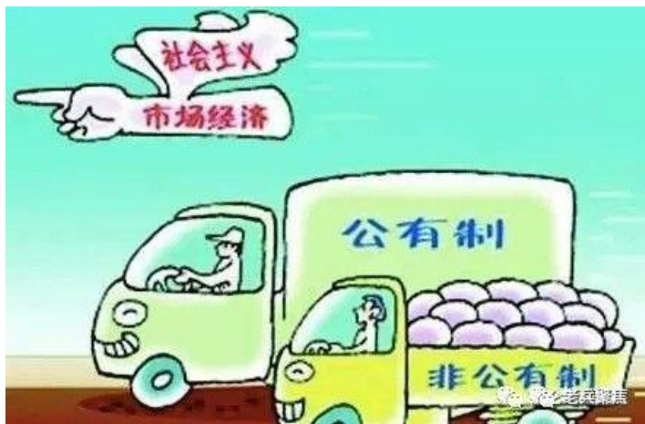
经济体制不断完善